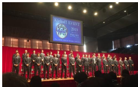
▲キックオフイベント