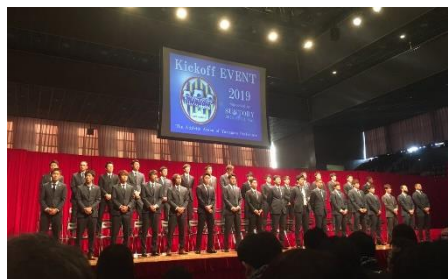
▲キックオフイベント