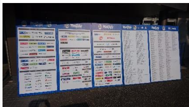
▲正会員・賛助会員紹介ボード