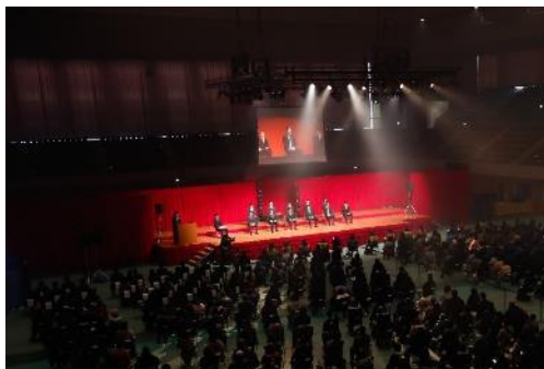
▲キックオフイベント