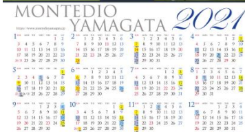
株式会社モンテディオ山形