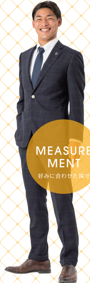
モンテディオ山形 31 半田 陸 選手