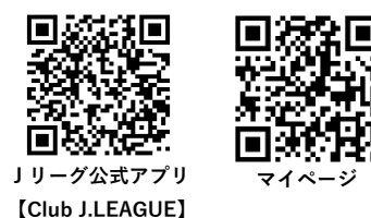
Jリーグ公式アプリ 【Club J.LEAGUE】

メニューより「ワンタッチパス連携」を選択し「ワンタッチパス ID を追加する」より情報カードに記載の会員番号を入力